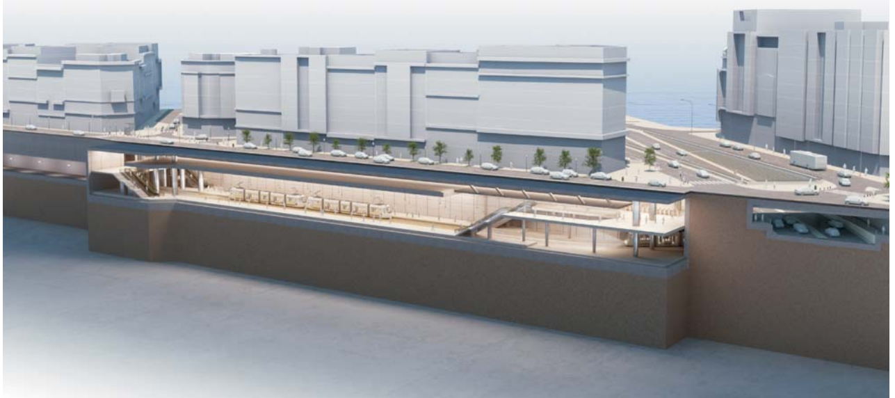
VISTA LATERAL DE LA ESTACI3N CALLE ALICANTE