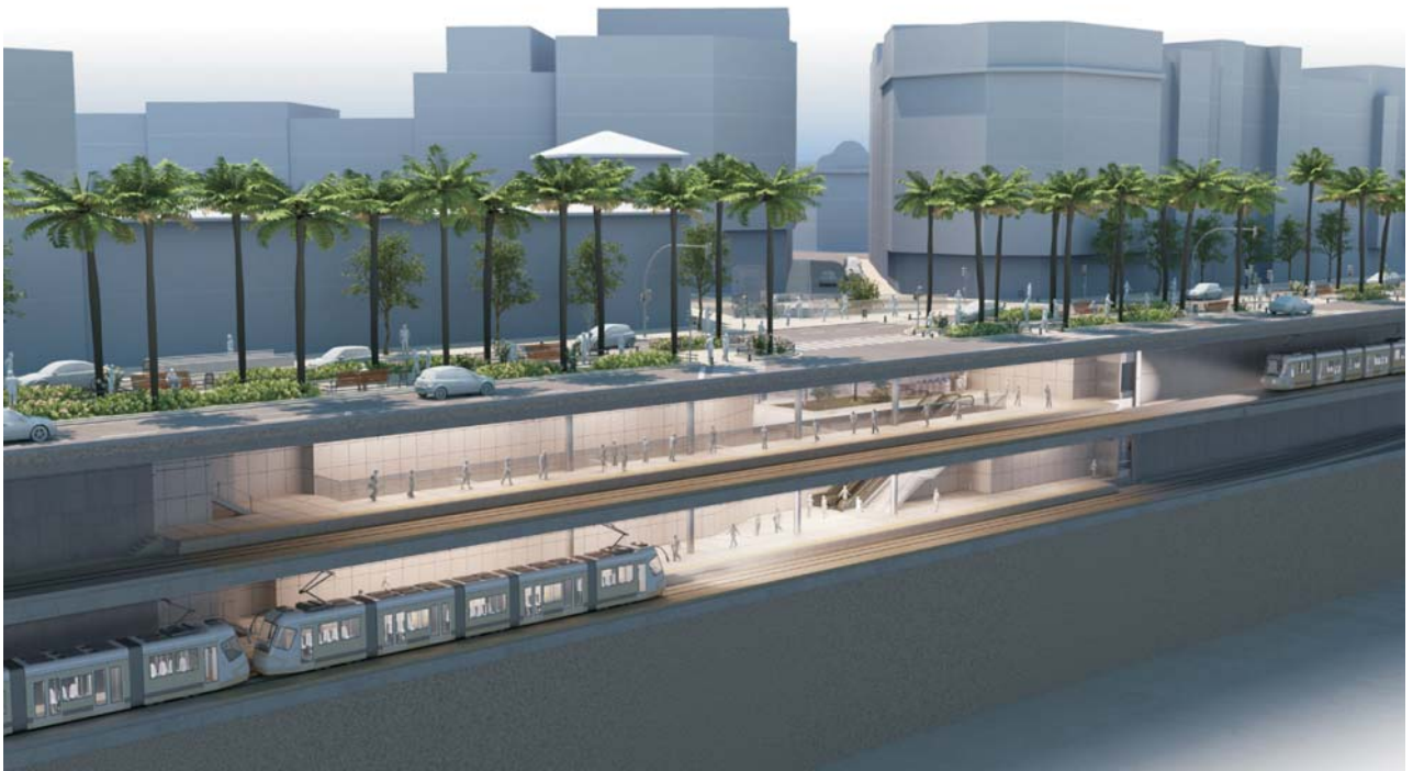
VISTA LATERAL DE LA ESTACI3N CALLE RUZAF3