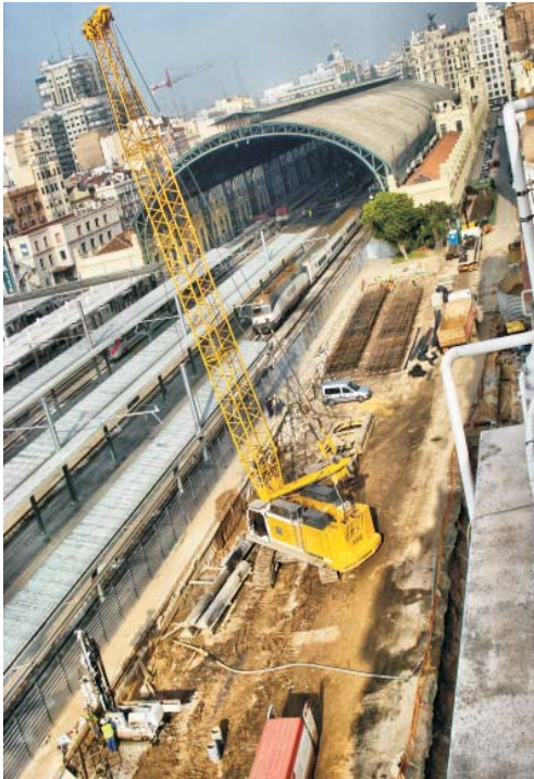
Excavación de muro pantalla