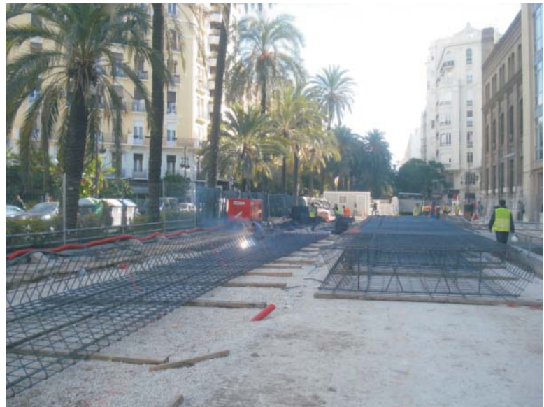
Ferrallado de armadura de muro pantalla