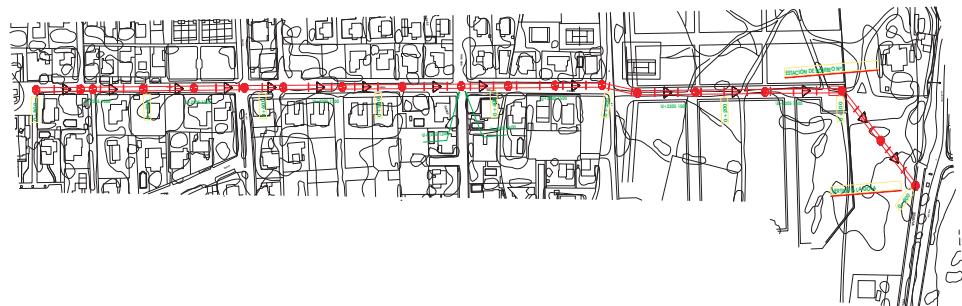
COLECTOR Nº 2