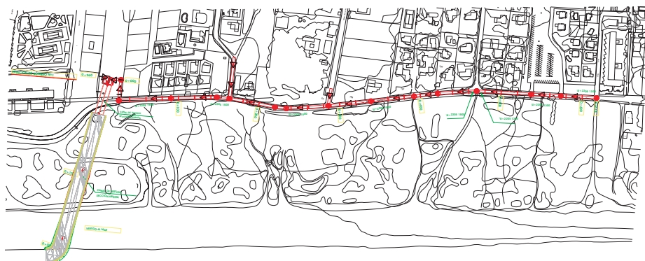
COLECTOR Nº 1